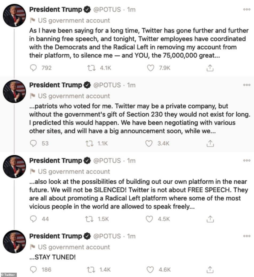
تصویر ۱۰ توییت های اعتراضی ترامپ به توییت از طریق صفحه ریاست جمهوری

ماده ۲۳۰، شبکه‌های اجتماعی را از هرگونه مسئولیت حقوقی در قبال مطالب منتشر شده از سوی کاربران مصون می‌دارد حال آنکه به ادعای ترامپ، این مسئله به ابزاری برای سوء استفاده و خاموش کردن صدای حزب جمهوری خواه در جریان انتخابات ۲۰۲۰ منجر شد. رئیس‌جمهور آمریکا در ادامه ادعاهای خود با اشاره به اینکه توئیتر رسانه آزادی نیست، افزود: «پیش بینی می‌کردم که چنین اتفاقی بیفتد. در حال مذاکره با چندین سایت دیگر هستیم و به زودی خبر بزرگی را اعلام می‌کنیم». اما شاید مهمترین بخش از پیام‌های ترامپ آن قسمتی است که در آن از تلاش برای ایجاد پلتفرم رسانه‌ای خودش خبر داد. وی در این باره نوشت: «همزمان امکان ایجاد پلتفرم خودمان در آینده نزدیک را هم بررسی می‌کنیم. ما ساکت نخواهیم شد».