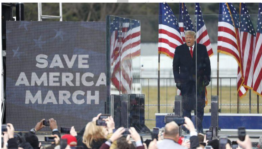
تصویر ۲ سخنرانی ترامپ در جمع هوادارانش ۶ ژانویه در واشنگتن

تجمع هواداران ترامپ در روز چهارشنبه ۶ ژانویه بهانه حادثه ای شگفت انگیز در تاریخ آمریکا شد. هواداران متعصب ترامپ همزمان با برگزاری جلسه کنگره که به منظور تأیید پیروزی جو بایدن تشکیل شده بود، به قلب دموکراسی آمریکایی یعنی ساختمان کنگره حمله ور شدند و این مقر مهم را چند ساعتی اشغال کردند.