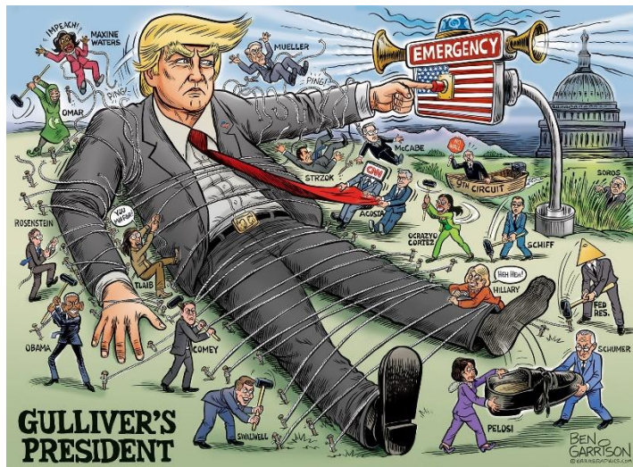
تصویر ۷ کاریکاتور رئیس جمهور گالیور؛ در اعتراض به مسدود شدن حساب های کاربری ترامپ

و ... می خواهند او را ببندند. در مقابل هوادارن بایدن و برخی از طرفداران ترامپ که پس از حادثه ۶ ژانویه از وی برائت جسته بودند این اقدام توییت را تحسین کردند.