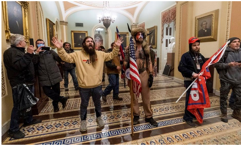
تصویر ۳ اشغال کنگره آمریکا توسط هواداران ترامپ

همزمان با این اتفاق، جو بایدن رئیس جمهور منتخب با حضور در قاب تلویزیون این روز را سیاه‌ترین روز تاریخ آمریکا نامید و از ترامپ خواست با حضور در تلویزیون هوادارانش را کنترل کند. ترامپ با انتشار توییتی ضمن تکرار ادعایش مبنی بر تقلب و تمجید از هوادارانش از آنها خواست به خانه هایشان برگردند. او در این توییت گفت «این روز را برای همیشه به خاطر بسپارید». پس از این توییت بود که توییت در اقدامی بی سابقه حساب کاربری ترامپ را به مدت ۱۲ ساعت مسدود کرد. دیگر پلتفرم‌ها مانند یوتیوب، اینستاگرام و فیسبوک نیز تصمیم مشابهی گرفتند.