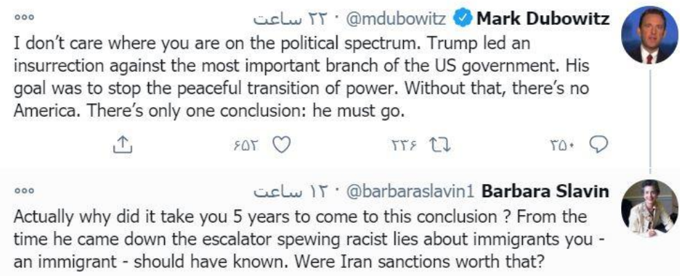
تصویر ۸ سؤال اسلاوین از دوبوویتز: چرا پس از ۵ سال به این نتیجه رسیدی؟

«مارک دوبوویتز» صهیونیست و مدیر بنیاد دموکراسی که از حامیان سرسخت ترامپ در سال های گذشته بوده از جمله افرادی است که با انتشار توئیتی از ترامپ برائت جسته و گفته او باید برود. پس از انتشار این توئیت بسیاری از جمله «بارا اسلاوین» مدیر موسسه آتلانتیک به وی پاسخ داده که «حالا چرا پس از ۵ سال حمایت به این نتیجه رسیدی؟ واقعاً تحریم های ایران این قدر برایت مهم بود».