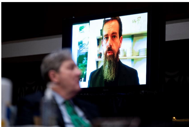
تصویر ۱ حضور دورسی و زاکریرگ در مجلس و پاسخ به سؤالات تد کروز

تجمع هواداران ترامپ در روز چهارشنبه ۶ ژانویه بهانه حادثه ای شگفت انگیز در تاریخ آمریکا شد. هواداران متعصب ترامپ همزمان با برگزاری جلسه کنگره که به منظور تأیید پیروزی جو بایدن تشکیل شده بود، به قلب دموکراسی آمریکایی یعنی ساختمان کنگره حمله ور شدند و این مقر مهم را چند ساعتی اشغال کردند.