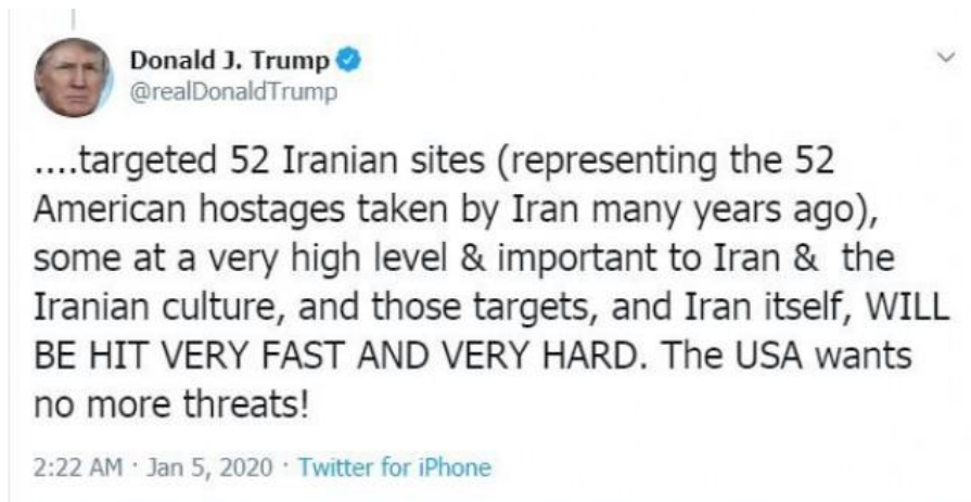
تصویر ۱۱ تهدید حمله نظامی به ۵۲ نقطه از ایران توسط دونالد ترامپ در توییتر

این اقدام بی سابقه رسانه‌های اجتماعی موجب حیرت کارشناسان شده است برخی اعتقاد دارند این راهی برای جلوگیری از گسترش اطلاعات غلط و ترویج خشونت است. در طرف مقابل هستند کسانی که اعتقاد دارند این مسدود کردن‌ها چیزی جز بستن آزادی بیان و مقابله با جریان آزاد اطلاعات نیست. علاوه بر این دو رویکرد یک پرسش بزرگ برای همه مخاطبان باقی می‌ماند که اگر هدف توییتر و رسانه‌های اجتماعی از مسدودسازی حساب کاربری ترامپ مقابله با ترویج خشونت است چرا وقتی او صراحتاً ایران را به حمله نظامی تهدید می‌کرد و از دستور خود مبنی بر ترور فرمانده نظامی ایران تمجید می‌کرد، نه تنها حساب‌های وی را مسدود نکردند بلکه در حمایت از اقدام تروریستی او صفحات ده‌ها هزار کاربر را به علت انتشار تصویری از «سپهبد قاسم سلیمانی» برای همیشه مسدود کردند.